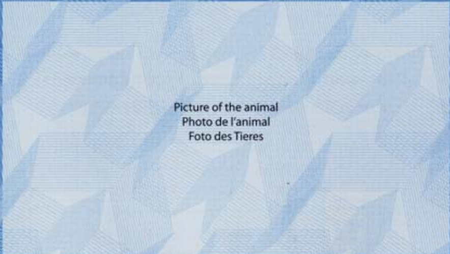
Picture of the animal Photo de l'animal Foto des Tieres

Issued by the Association LAREU (Llama & Alpaca Registries Europe), P.O. Box 666, 3900 Brig-Glis (Switzerland). For national contacts please consult the LAREU web page: www.lareu.org Délivré par l'Association LAREU (Llama & Alpaca Registries Europe), P.O. Box 666, 3900 Brig-Glis (Suisse). Pour contacts nationaux, veuillez consulter le site web de LAREU: www.lareu.org Ausgestellt durch den Verein LAREU (Llama & Alpaca Registries Europe), P.O. Box 666, 3900 Brig-Glis (Schweiz). Die nationalen Kontaktstellen entnehmen Sie bitte der LAREU Webseite: www.lareu.org